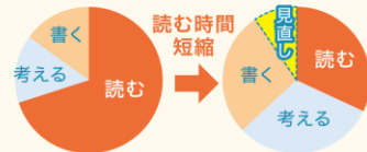
■小学校の標準授業時数

読む速さをアップさせることで、テストでも考える時間や見直しの時間を確保することもできます。